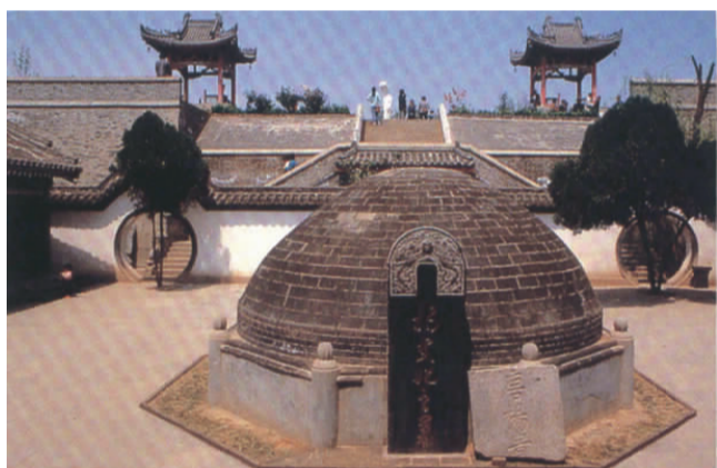
蹟古護們紳士？容美可土上墳 就砌磚青 塚妃貴楊