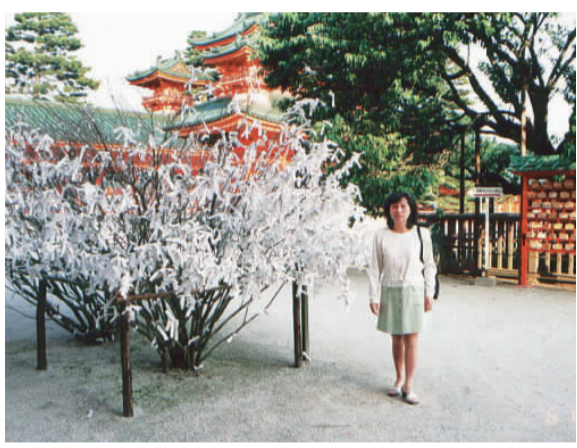
樹於繫封籤下下將人日 難災除消願祈 (左圖) 上 爲枯死，一般 有枯死，一般 人相信，這是 爲了這棵繁滿 了籤封的樹， 爲他們承擔了 厄業的證明。

【記者蘇菁菁報導】在日本各寺廟神社的大殿(本堂)前，都可看見一二株繁滿了籤封的樹，枝葉蕭條的模樣和四周其他茂盛的樹木，形成強烈的對比。和世界上所有宗教道場一樣，日本的寺廟神社擔負起安撫人心、消災解厄的使命，虔誠的人們來到寺廟，總不忘求籤，或問闔家平安、或求事業順利、或爲貧得良緣。 ……；不同的是，日本的寺廟都會在大殿前選定一二棵樹，當做「消災解厄樹」，求到「下下籤」的人，爲了不把厄運帶回來，就把籤封繫在這些樹上，讓寺廟的早晚課誦爲他們消災解厄。 京都清水寺是一座千年歷史的寺院，該寺大殿前的這棵「消災解厄樹」，看起來形將枯萎，和四周茂盛的樹木對比之下，成爲奇特的景觀。 樹本身並沒有枯死，一般人相信，這是爲了這棵繁滿了籤封的樹，爲他們承擔了厄業的證明。