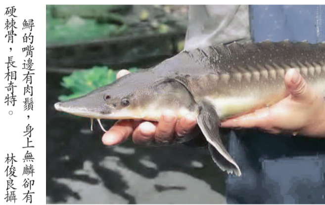
鮮的嘴邊有肉鬚，身上無鱗卻有硬棘骨，長相奇特。

世間上的人，種種的欲求，都是為了追求快樂。快樂處處求，大致分為兩種，一種是欲樂，一種是法樂。 所謂欲樂，一般說，世間上有一「五欲」——財、色、名、食、睡。財——財富人人都想擁有；色——財富固然可以為人帶來快樂，但是「人為財死」。因此，有錢有財有時也會帶來許多的災禍，財富有時也會造成許多的不幸。 罪業，有時候也是由吃所產生的。睡——睡，本來也是一種享受，但是睡多了，成為懶散，被人譏為「好吃懶做」，自己的前途也難以有很好的開展。 所以，世間的欲樂之樂，只能說為「欲樂」，有染污性、有短暫性、有不確定性，所以到個人種種的辛苦，種種的勤勞所追求的欲樂，原來裏面也有危害健康的毒汁。 自古以來，聖賢都是教誡大家不可以縱欲。佛陀雖然不是完全教誡世人要禁欲，但是，欲需要疏導，欲海波瀾，需要導之以正，所以要