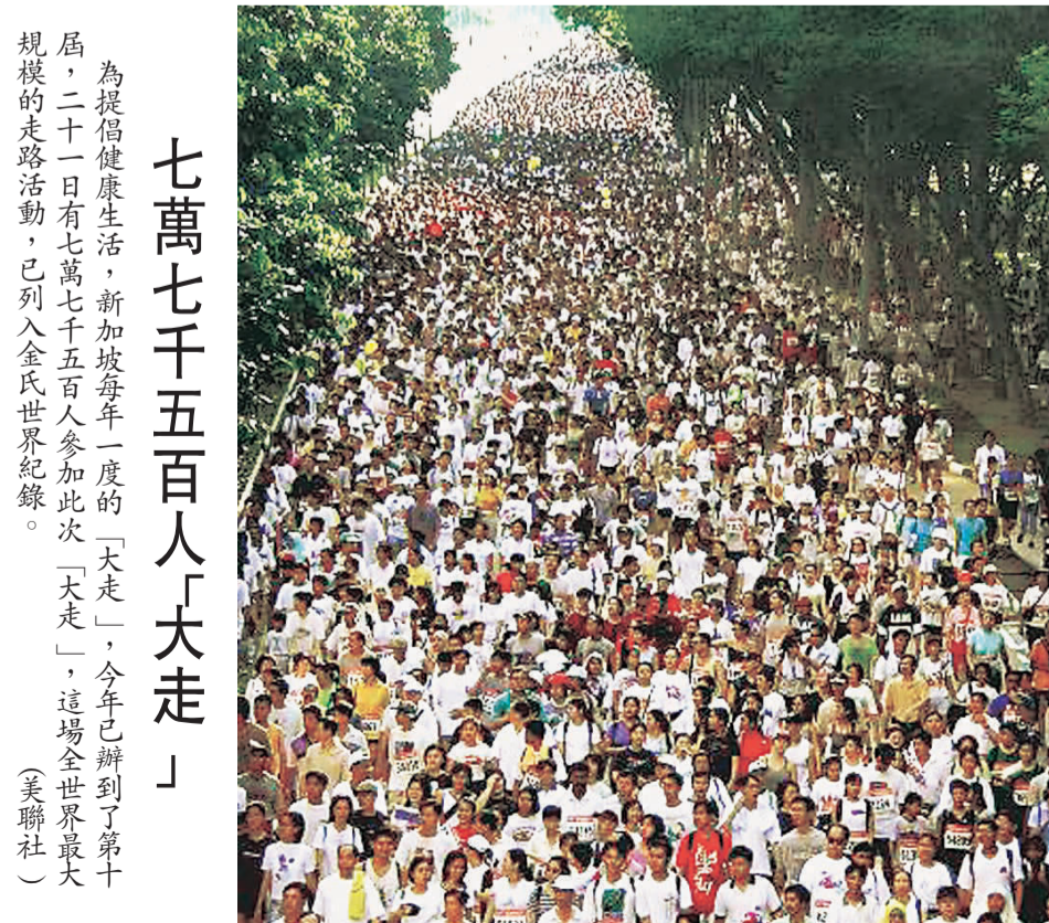
為提倡健康生活，新加坡每年一度的「天走」，今年已辦到了第十屆，二十一日有七萬七千五百人參加此次「天走」，這場全世界最大規模的走路活動，已列入金氏世界紀錄。

，動活碑念紀油塗爬的統傳了行舉日九十校官軍海市的斯里波納安州蘭里馬在登赫的高呎廿、油滿滿塗在放了下取，上肩的學同在站斯寧蘭，森納生學校該九十小時一了花他。帽軍的生級年高頂一上放並，帽軍的生新頂一的上頂碑念紀（社聯美）。一之動活的週階授視慶是動活個這。頂碑上爬才，秒四十四分