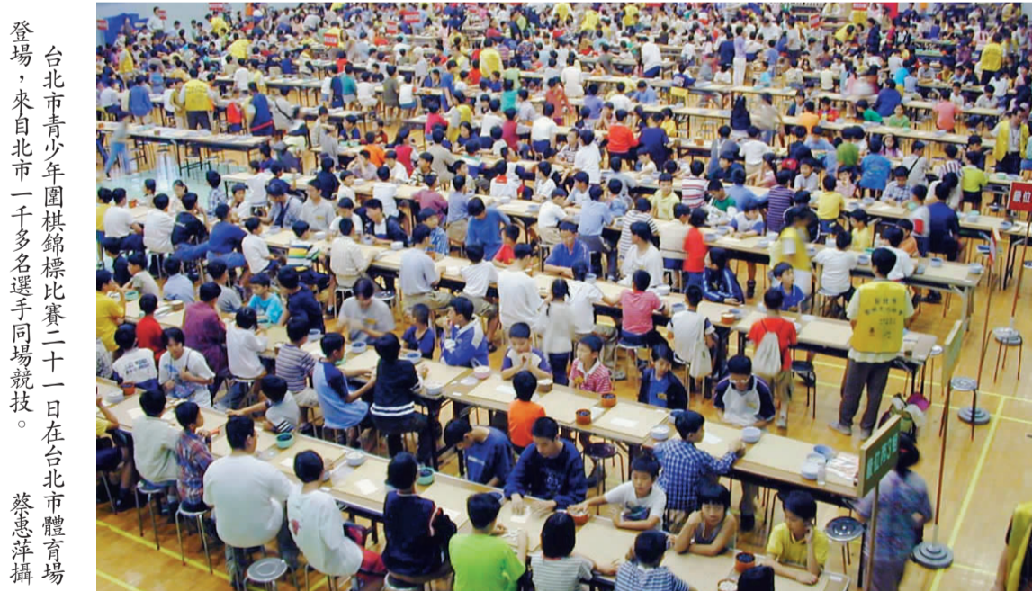
台北市青少年圍棋錦標賽二十一日在台北市體育館登場，來自全市一千多名選手同場競技。

【本報訊】八十九年度台北市青少年圍棋錦標賽二十一日在台北市立體育館舉行，超過一千名來自全市的小棋手對弈，吸引了大批的棋友及觀眾觀賽。前清華大學校長、現任中華民國圍棋協會理事長沈君山攜子參加盛會，父子同堂，頗有新火相傳的意味。 台北市圍棋協會理事長林晉章表示，這次比賽不僅人數空前，參與的學校也相當踴躍，可見圍棋風氣鼎盛。在比賽開始前，會場中不時有小朋友嘻笑鬬跳，等到鈴聲響起，小選手紛紛入座，浮動的神情馬上沉穩下來，專注地進入黑白子的世界。 林晉章表示，近幾年來，學習圍棋的風氣很盛，許多人都加入了對弈的行列中。根據他的統計，目前台北市約有十萬多萬的圍棋人口，全台灣約有五十萬左右，以台北市的密度最高。他透露，甫卸任的前總統李登輝也是圍棋的愛好者，有一次，他與國際圍棋高手林海峰前往總統府晉見總統，李登輝提起他年少開始學習圍棋時的一段往事，那時他住在日式房子，每晚入睡時望著天花板交叉的方格線就布起棋局。 海峰文教基金會執行長楊泰雄說，圍棋被譽為「藝之孤」，因為它可以訓練人的邏輯、思考及抗壓力，圍棋最吸引人的就是凝慮的喜悅，經過縝密、仔細的長考後所出的棋，包含了選手的智慧和經驗，進而打發出致命一擊，其中的柳暗花明正是棋友樂此不疲的地方。至於究竟妙在何處？楊泰雄笑語，正是「黑白分天下」，讓「大小樂其中」吧！