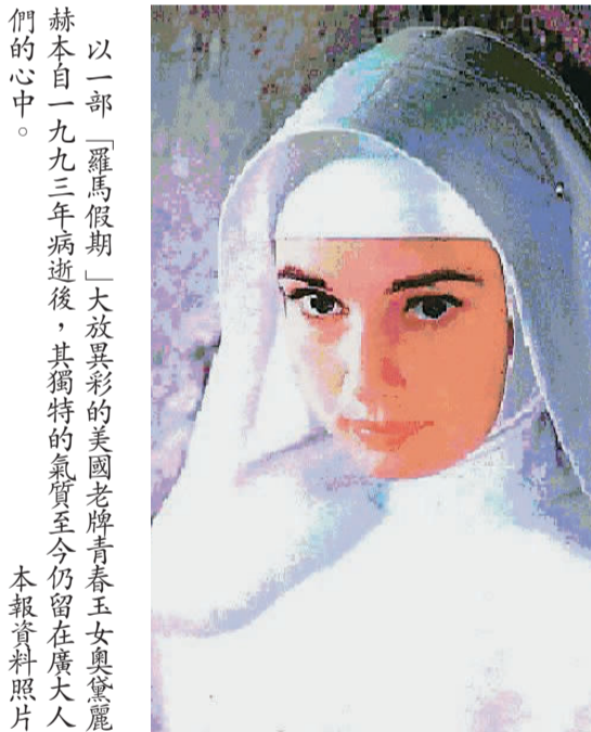
以一部「羅馬假期」大放異彩的美國老牌青春玉女奧黛麗赫本自一九九三年病逝後，其獨特的氣質至今仍留在廣大人們的心中。

【本報訊】五〇年代以一部「羅馬假期」大放異彩的美國老牌青春玉女奧黛麗赫本，自一九九三年病逝後，其獨特的氣質至今仍留在廣大人們的心中。最近有消息人士透露，赫本的「死期」有可能是自己決定的。 演出「羅馬假期」的安娜公主一舉成名後，赫本雖然在四十年代的演藝生涯中扮演無數的角色，一九八八年，赫本卸下明星的光環，擔任聯合國兒童基金會的親善大使，將整個身心投入關懷不幸兒童的實際行動。