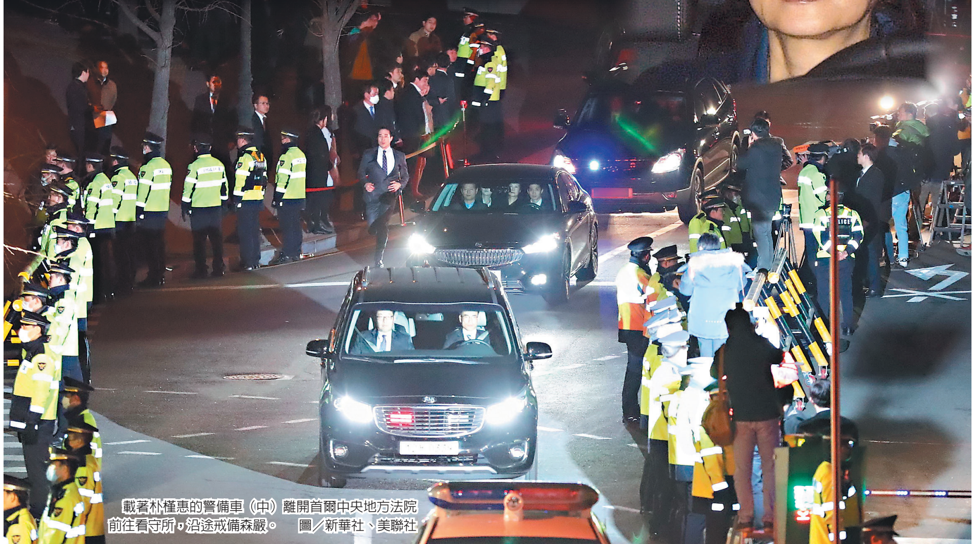
載著朴槿惠的警備車(中)離開首爾中央地方法院 前往看守所,沿途戒備森嚴。