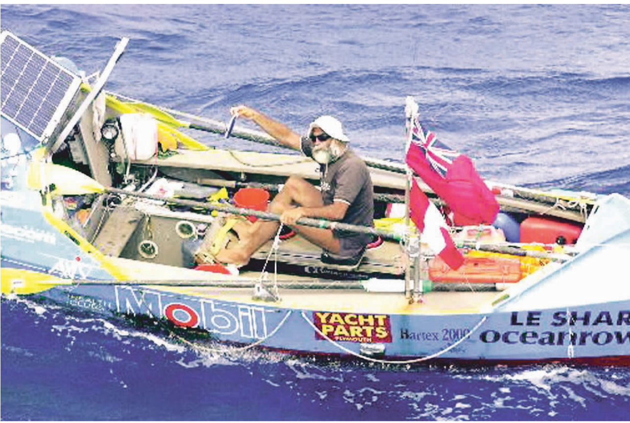
從秘魯到澳洲 英冒險家完成壯舉 三月十三日完成日行三十里...